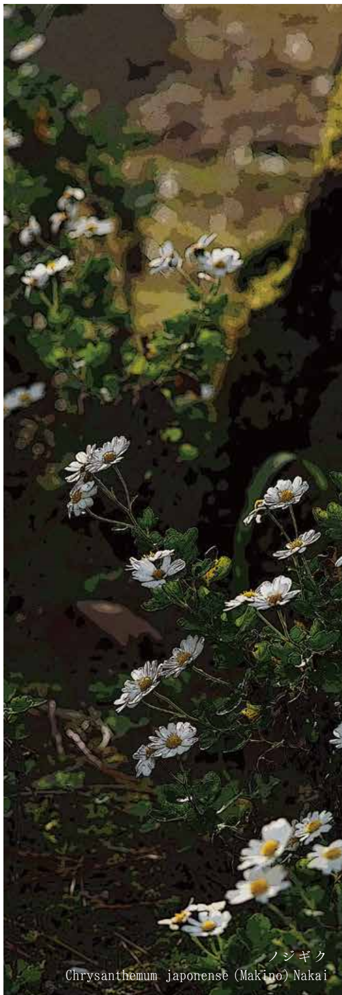
ノジギク Chrysanthemum japonense (Makino) Nakai