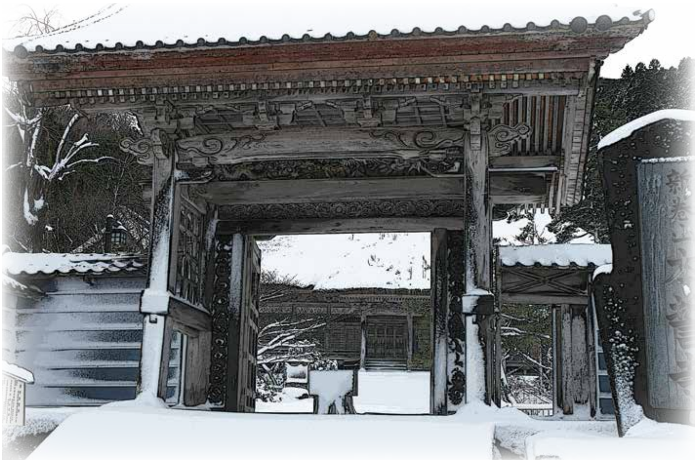
阿岸本誓寺（あぎしほんせいじ）（輪島市門前町南）